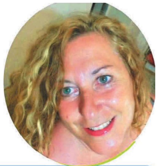
EMILIA MEZZATESTA SCUOLA PRIMARIA

Ho accettato di candidarmi in questa lista perché credo nelle cose umili, ho sempre lottato per il riscatto sociale e la dignità della persona, promuovendone la crescita personale e sociale. Conosco il mondo della scuola paritaria, della scuola pubblica e della cooperazione sociale. Ogni giorno della mia vita dal 1990 l'ho vissuto educando, empatizzando con alunni, colleghi, famiglie, associazioni. Ritengo che la nostra presenza nel mondo del sindacato dei "Grandi" possa fare la differenza. Se sei sfiduciato/a e non ti senti ascoltato/a sappi che tanti docenti sono nella tua stessa condizione. Fai un passo di fiducia, aiutaci a riappropriarci della dignità del ruolo, ormai perso nel tempo.