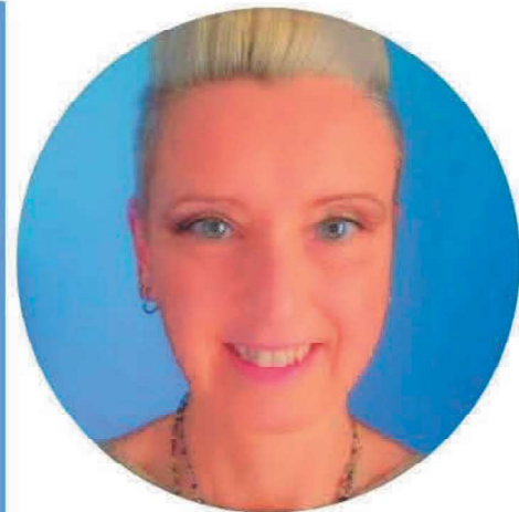
MARTA ERODIANI SCUOLA PRIMARIA

Sono fermamente convinta che la scuola sia un luogo di crescita fondamentale per gli studenti e che il benessere di tutti i componenti della comunità scolastica sia un prerequisito per il successo formativo. Per questo, se eletta al CSPI, mi impegnerò con tenacia e passione a rappresentare gli interessi di tutti, lavorando per un sistema scolastico sempre più inclusivo, equo ed efficiente."