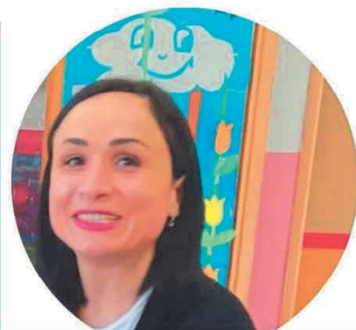
CAROLINA PARISI SCUOLA DELL' INFANZIA

Per me insegnare non è solo un lavoro, ma una vera e propria passione. Ho scelto questa professione con consapevolezza, lasciando alle spalle un posto fisso in un'altra pubblica amministrazione. Il desiderio di trasmettere conoscenze e di fare la differenza nella vita dei ragazzi ha prevalso sulla stabilità economica. Conosco bene le sfide e le difficoltà che ogni giorno affrontiamo nelle scuole. Per questo motivo, ho deciso di candidarmi al CSPI: voglio essere la vostra voce nelle istituzioni e portare avanti le vostre esigenze e preoccupazioni. Voglio rappresentare al meglio la nostra categoria e contribuire a costruire un futuro migliore per la scuola italiana.