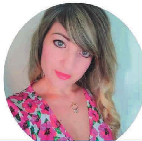
Vanessa Acri Scuola Primaria

Voglio una scuola ove integrazione e inclusione non siano solo belle parole sulla carta ma qualcosa di reale e concreto. Voglio che i docenti si sentano motivati nel loro lavoro perché adeguatamente riconosciuto nella sua dignità e adeguatamente remunerato. Voglio docenti con la voglia di portare i bambini in gita perché lo Stato gli riconosce la trasferta e li tutela giuridicamente. Voglio una scuola che abbia ambienti idonei all'apprendimento e con i giusti strumenti e non tanti fondi investiti male a causa dei troppi vincoli imposti. Insieme possiamo! Scegli NoiScuola Bene Comune.