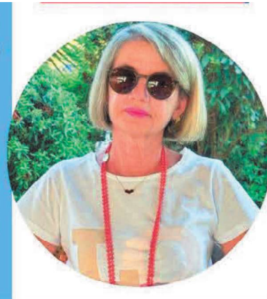
Michela Acconci Scuola Primaria

Ecco il perché della mia candidatura e la scelta di questo Sindacato che ha fatto proprie le lotte per una SCUOLA DEMOCRATICA, LIBERA che sappia dare dignità' alla professione degli insegnanti e che passi anche da una " giusta" riqualificazione economica.